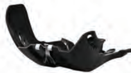
ΠΡΟΣΤΑΤΕΥΤΙΚΕΣ ΠΟΔΙΕΣ ΚΙΝΗΤΗΡΑ