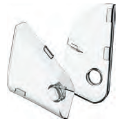
ΔΙΑΦΑΝΗ ΠΡΟΣΤΑΤΕΥΤΙΚΑ ΠΛΑΪΩΝ ΚΑΠΑΚΙΩΝ