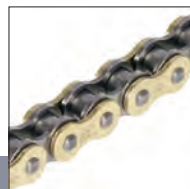
Gold & Black