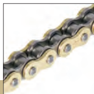
Gold & Black