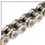
All Silver (Nickel)