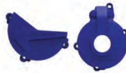
ΠΡΟΣΤΑΤΕΥΤΙΚΑ ΚΑΛΥΜΑΤΑ ΚΙΝΗΤΗΡΑ