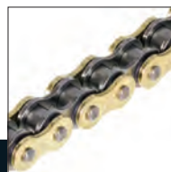
Gold & Black