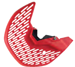
ΠΡΟΣΤΑΤΕΥΤΙΚΑ ΠΙΡΟΥΝΙΟΥ ΚΑΙ ΔΙΣΚΟΥ