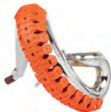
ΠΡΟΣΤΑΤΕΥΤΙΚΑ ΛΑΙΜΟΥ ΕΞΑΤΜΙΣΗΣ