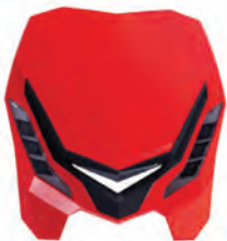
LED ΕΜΠΡΟΣΘΙΑ ΦΑΝΑΡΙΑ - ΜΑΣΚΑ