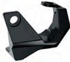
ΠΡΟΣΤΑΤΕΥΤΙΚΟ ΜΠΟΥΚΑΛΑΣ ΠΙΡΟΥΝΙΟΥ