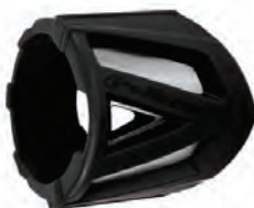
ΠΡΟΣΤΑΤΕΥΤΙΚΑ ΤΕΛΙΚΟΥ ΕΞΑΤΜΙΣΗΣ