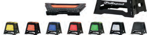
ΑΝΑΔΙΠΛΟΥΜΕΝΟ ΣΤΑΝΤ ΠΙΣΤΑΣ