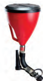
ΠΡΟΟΤΑΝΕ ΔΟΧΕΙΟ ΠΛΗΡΩΣΗΣ