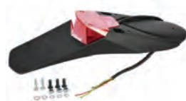
LED ΟΠΙΣΘΙΑ ΦΑΝΑΡΙΑ ΣΤΟΠ