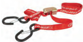
ΙΜΑΝΤΕΣ ΠΡΟΣΔΕΣΗΣ - ΣΥΣΦΙΞΗΣ