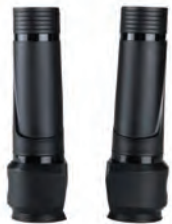
ΠΡΟΣΤΑΤΕΥΤΙΚΑ ΕΠΙΛΩ ΜΕΡΟΥΣ ΠΙΡΟΥΝΙΟΥ