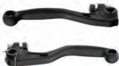
ΑΡΤ ΑΘΡΑΥΣΤΕΣ ΜΑΝΕΤΕΣ