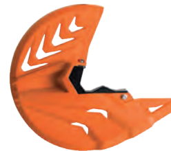
ΠΡΟΣΤΑΤΕΥΤΙΚΑ ΠΙΡΟΥΝΙΟΥ ΚΑΙ ΔΙΣΚΟΥ