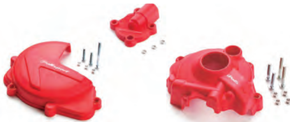
ΠΡΟΣΤΑΤΕΥΤΙΚΑ ΚΑΛΥΜΑΤΑ ΚΙΝΗΤΗΡΑ