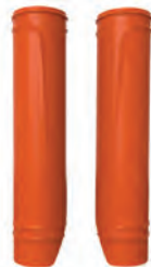
ΠΡΟΣΤΑΤΕΥΤΙΚΑ ΚΑΤΩ ΜΕΡΟΥΣ ΠΙΡΟΥΝΙΟΥ